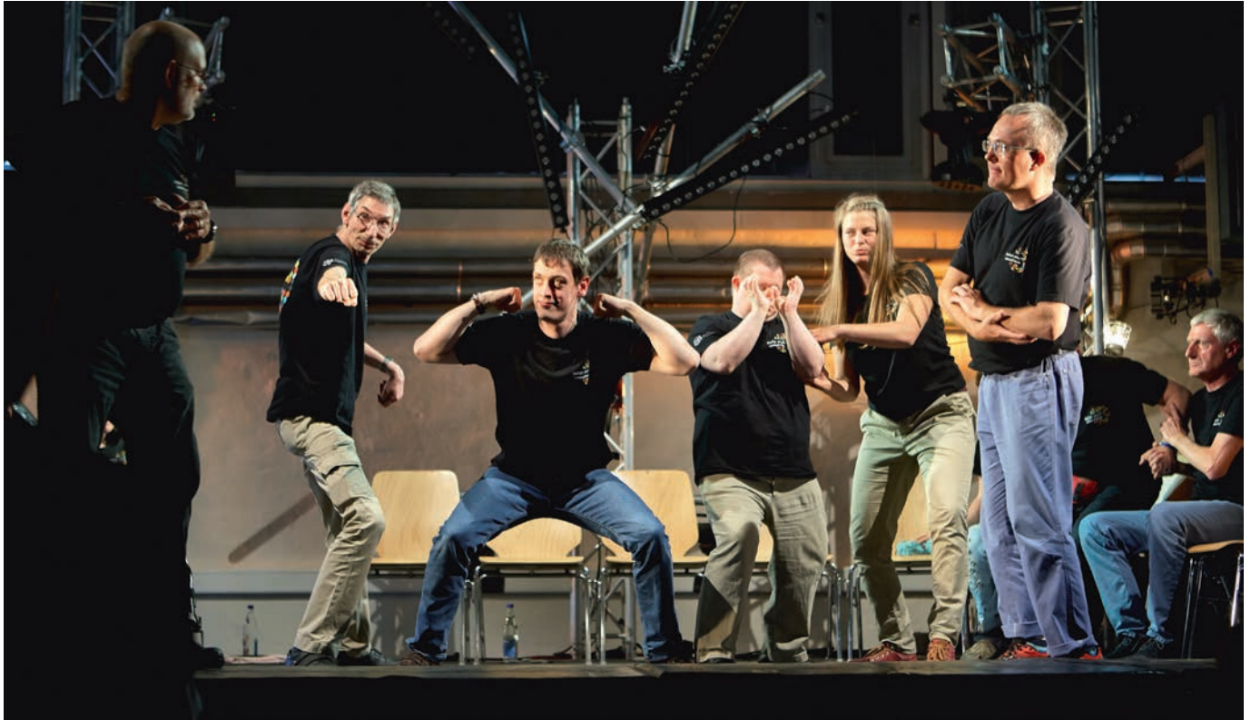
Theatergruppe „Tobak“ der Offenen Behindertenarbeit der Lebenshilfe Bamberg

In der Theatergruppe „Tobak“ spielen Menschen mit und ohne Beeinträchtigung unter einer professionellen Theaterleitung zusammen Theater. Die Annäherung an das Theater erfolgt durch zahlreiche Improvisationen, die einen individuellen Zugang zu Handlung und Text eröffnen. Ziel ist es, gemeinsam Theaterstücke zu produzieren und öffentlich aufzuführen, die als Kunst bestehen können, unabhängig von den persönlichen Lebensbedingungen der Schauspieler.