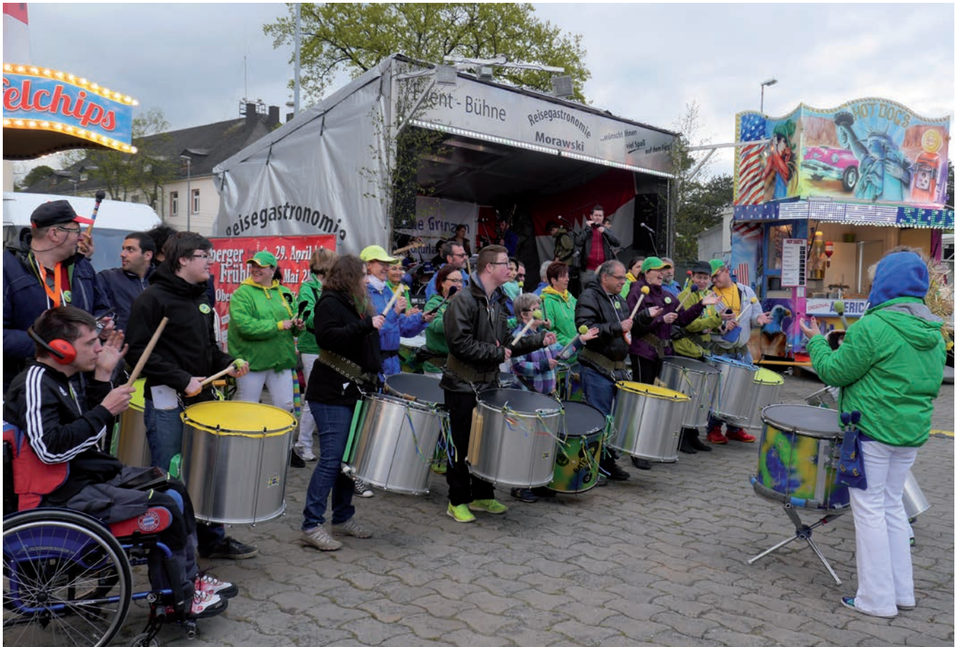
Auftritt der Percussiongruppe „Ramba Zamba“

In Zusammenarbeit mit der Bamberger Samba Gruppe „Bateria quem é“ wurde die Gruppe „Ramba Zamba“ gegründet, die brasilianische Percussionmusik macht.