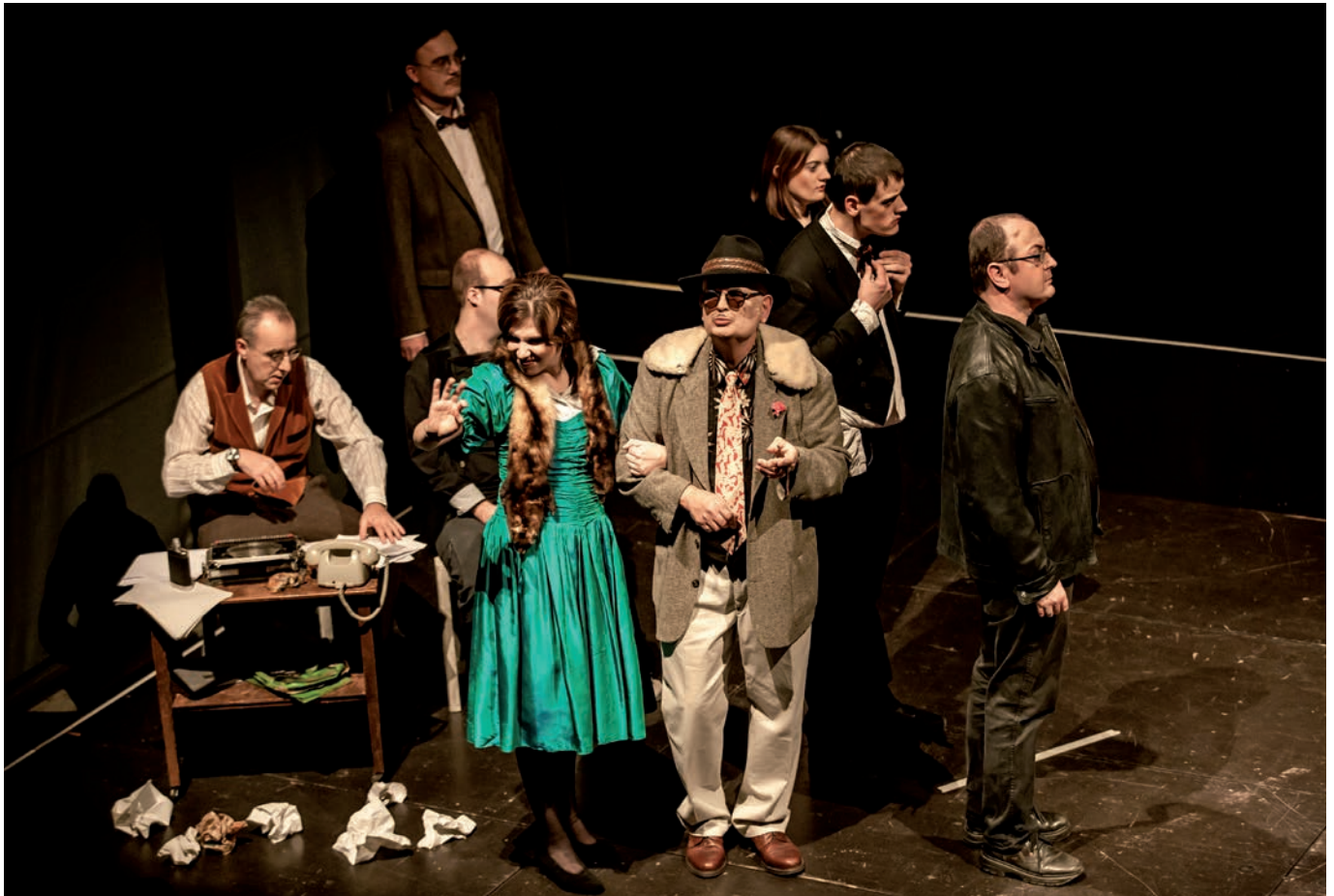
Theatergruppe „Tobak“ der Offenen Behindertenarbeit der Lebenshilfe Bamberg

Im März 2009 trat die UN-Behindertenrechtskonvention (UN-BRK) in der Bundesrepublik als völkerrechtlicher Vertrag in Kraft. Die UN-BRK geht in entscheidenden Punkten weiter als jede bislang gültige bundesdeutsche Gesetzesregelung. Sie bekräftigt, dass alle Menschenrechte und Grundfreiheiten allgemein gültig und unteilbar sind, einander bedingen und miteinander verknüpft sind und dass Menschen mit Behinderungen der volle Genuss dieser Rechte und Freiheiten ohne Diskriminierung garantiert werden muss. Die Konvention eröffnet neue Wege.