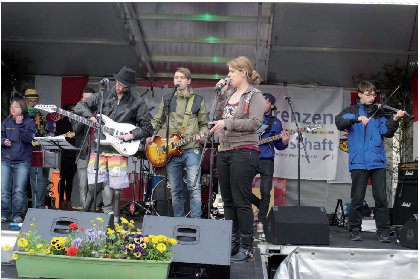
Auftritt von „Sleeping Ann“