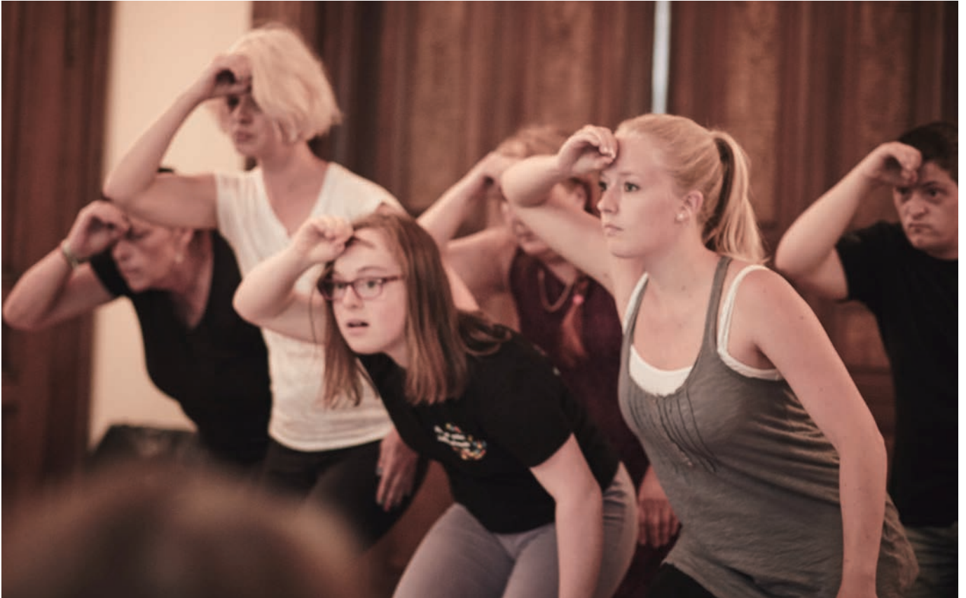
Tanzgruppe „Wackelkontakt“ der inklusiven Kulturwerkstatt

Im Bereich Tanz haben interessierte Tänzerinnen und Tänzer mit und ohne Behinderung die Gelegenheit, Tanz und Performance unter einer professionellen Leitung zu erlernen. Die Tanzgruppe „Wackelkontakt“ beschäftigt sich mit Körperwahrnehmung, physischem Training, Improvisation, Choreographie und Bühnenpräsenz. Im Tanz und der Bewegung wird Begegnung gelebt und dabei werden gemeinsam eigene Tanzstücke choreographiert.