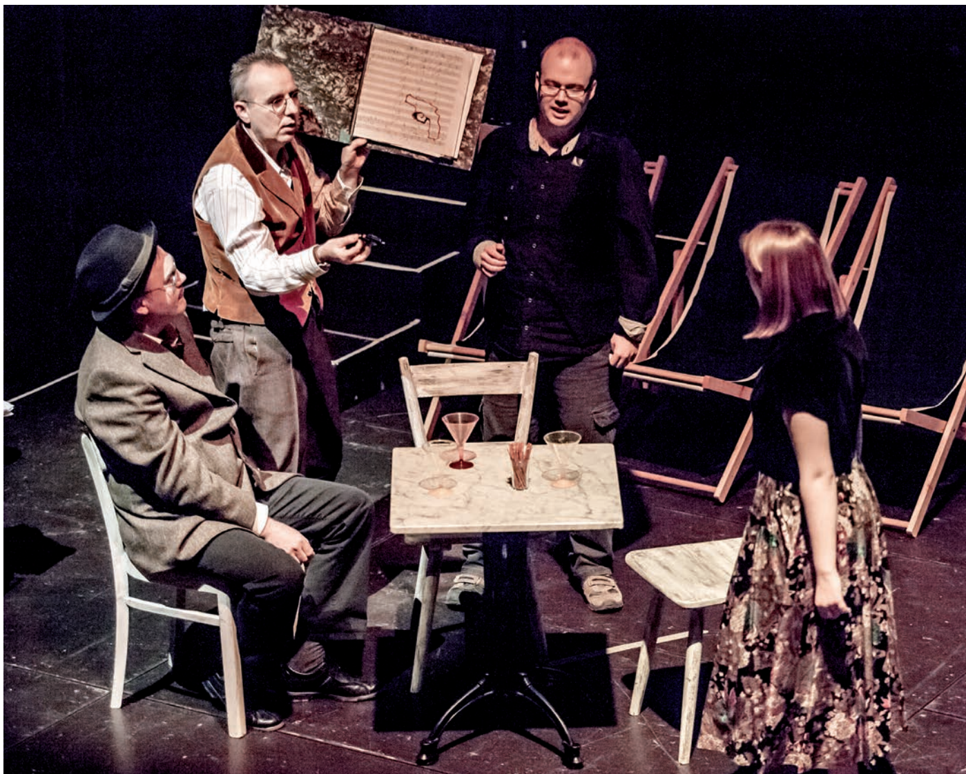
Theatergruppe „Tobak“ der Offenen Behindertenarbeit der Lebenshilfe Bamberg

„Wir sind noch nicht im Festsaal angelangt, aber wir sind eingeladen. Wir sehen schon die Lichter und hören die Musik!“ Ernesto Cardenal